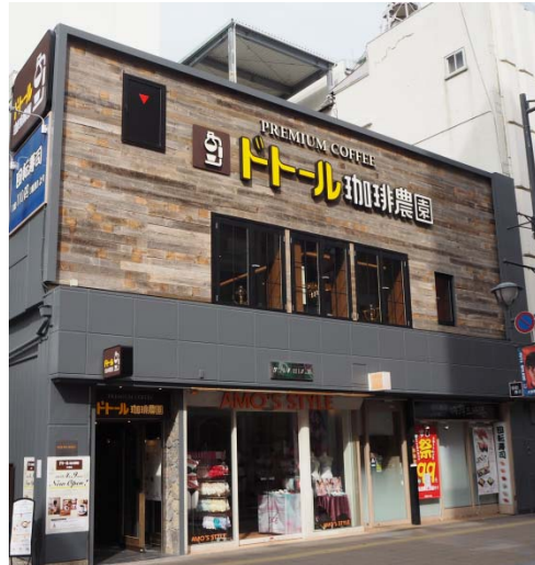
ドトール珈琲農園 大宮駅東口店